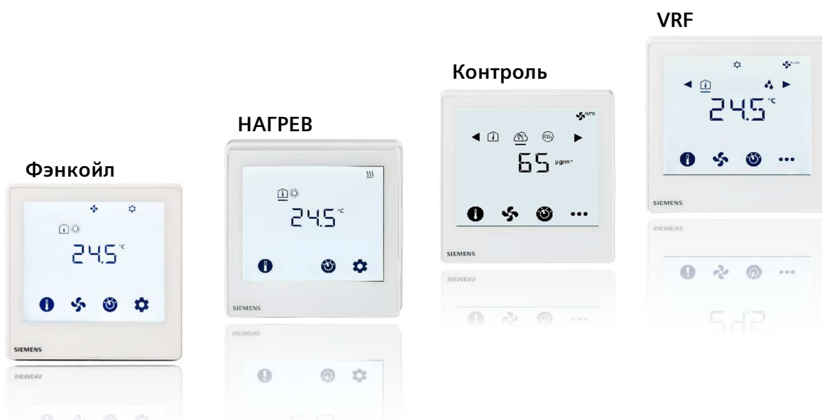
Отдельные комнатные термостаты с сенсорным экраном и термостаты с коммуникацией

Больше информации по ссылке https://intranet.siemens.com/hvac/thermostats